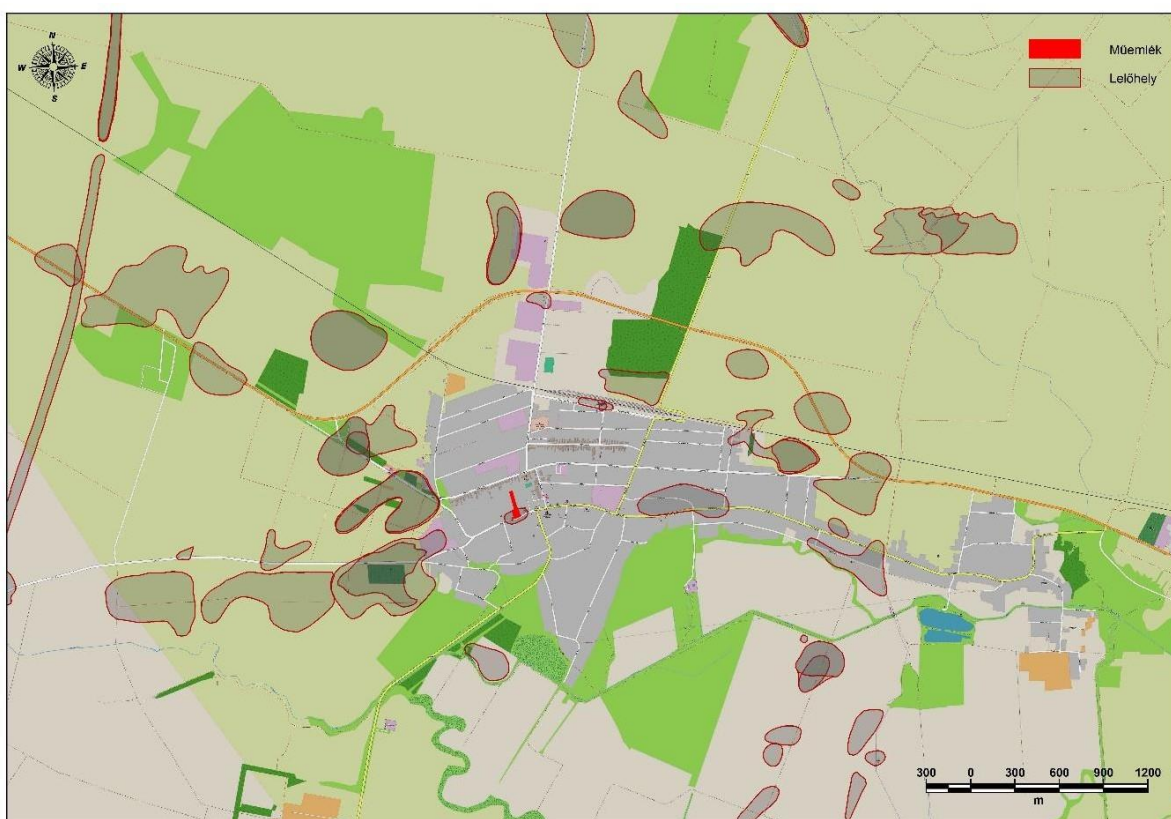
A régészeti lelőhelyek és a műemlék elhelyezkedése Biharkeresztesen

A koncepció készítése során az Örökségvédelemért felelős szervtől megkapott régészeti dokumentáció mellett, a megtartott terepbejárás alapján megállapításra került, hogy a tervezett fejlesztések konkrét hatásainak és lehetőségeinek meghatározása majd csak a rendezési eszközök elkészítésekor és a beruházási tervek elkészítésekor lehetséges. Ugyanakkor megállapításra került, hogy az alábbi térkép által is alátámasztva a városban elhelyezkedő régészeti lelőhelyek és a műemlék, illetve a lentebb felsorolt helyi védelem alatt álló objektumok sem az intenzív fejlesztésre kijelölt területeken helyezkednek el.